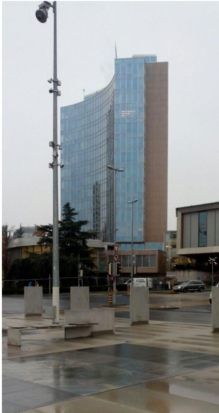
WIPO 總部大樓（即“AB” building）